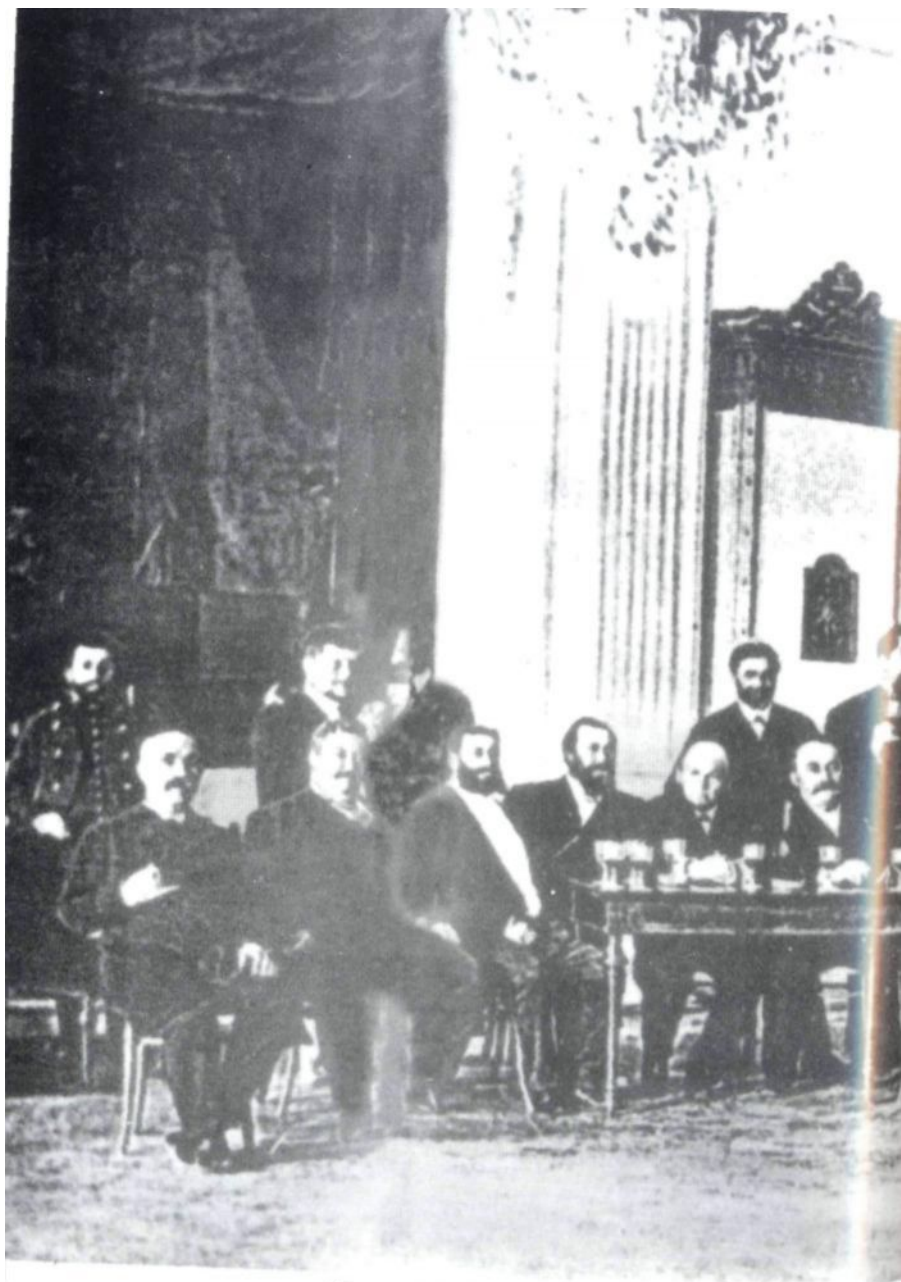
Депутаты Бакинской Городской Думы