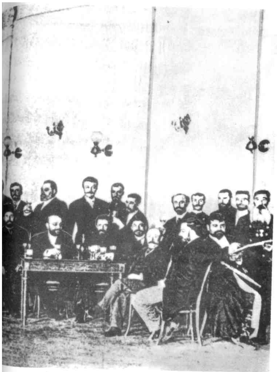
Deputies of Baku Citi Duma