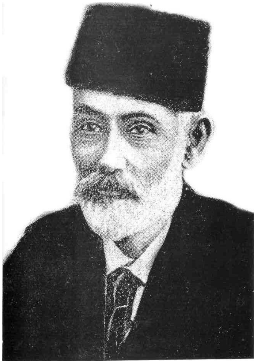
Гасан Бек Зардаби – Qasan Bek Zardabi