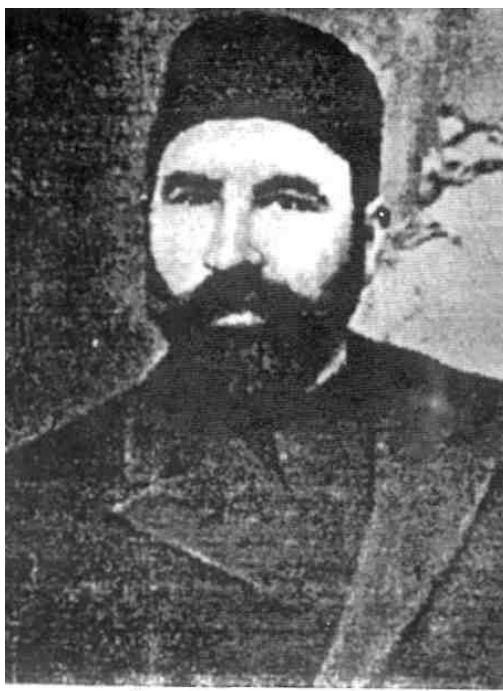
Гаджи Зейналлабдин Тагиев Haji Zeinalabdin Tagiev