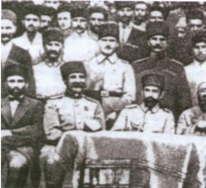
General Ə.Şıxlinski və Nuru paşa Gəncadə. İyun, 1918-ci il.

Azərbaycan Xalq Cümhuriyyətinin yaranması haqqında xarici ölkələrə göndərilən teleqram. 30 may, 1918-ci il.