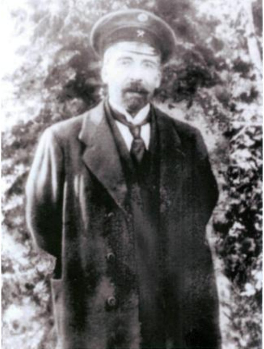
Azərbaycan Xalq Cümhuriyyətinin ilk xarici işlər naziri Məmməd Həsən Hacınski