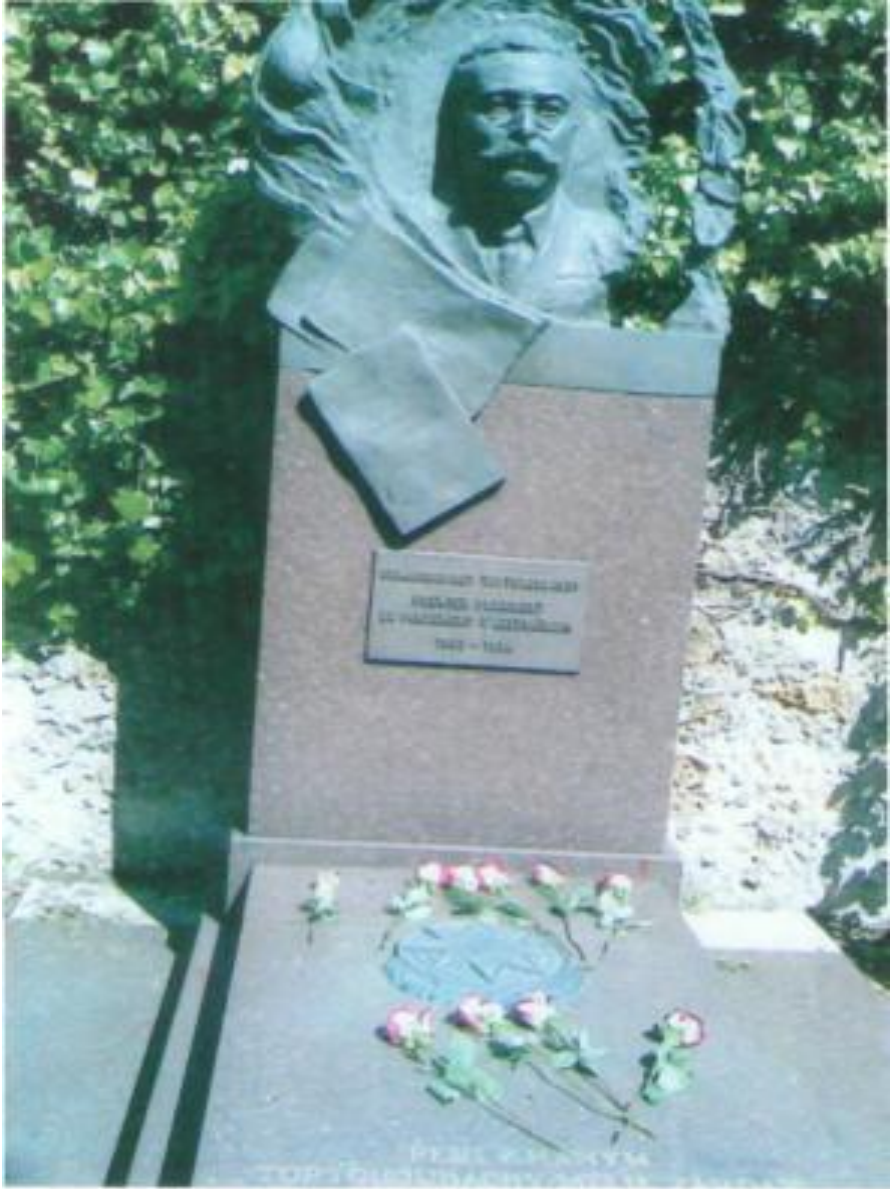
Ə.M.Topçubaşovun Paris yaxınlığındakı Saint Kloud şəhərindəki məzarlıqdakı qəbirüstü abidəsi.