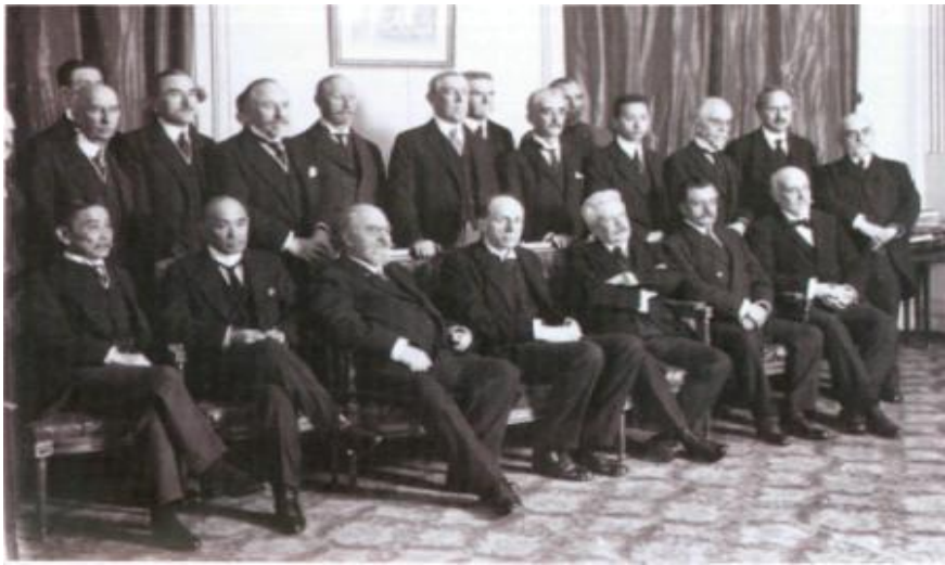
Müttəfiq dövlətlərin başçıları Paris sülh konfransında. Yanvar, 1919-cu il.