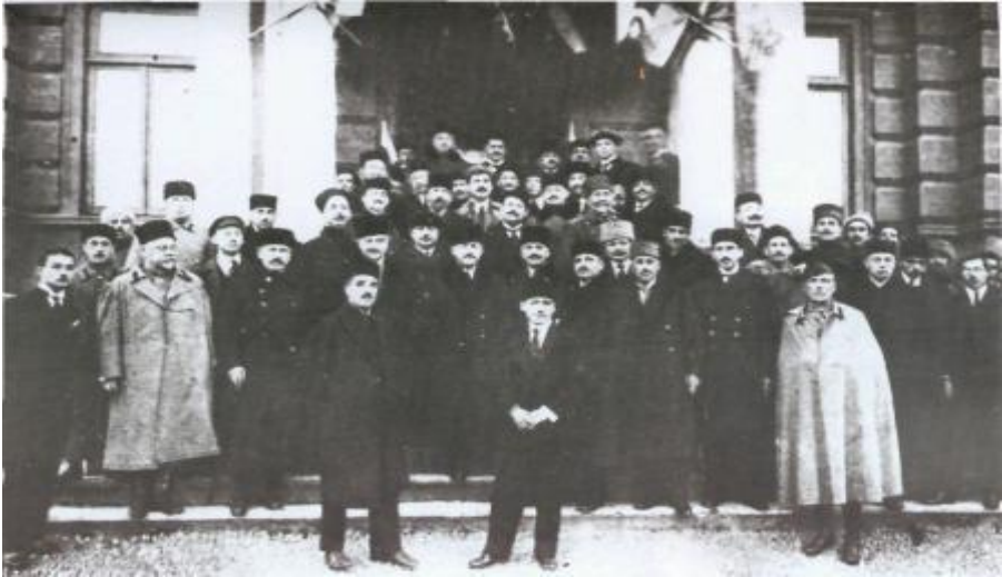
Azərbaycanın müstəqilliyinin Paris Sülh konfransı tərəfindən tanınması münasibətilə xarici işlər nazirliyində keçirilən qəbul. 14 yanvar, 1920-ci il.