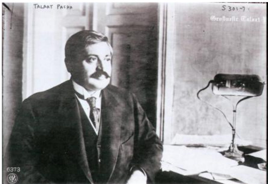
Türkiyə nazirlər kabinetinin sədri Tələt paşa