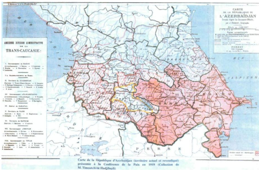
Azərbaycan nümayəndə heyətinin Paris sülh konfransına təqdim etdiyi xəritə. İyun, 1919-cu il.