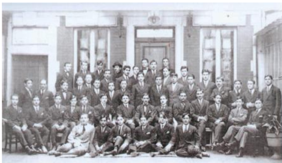
Azərbaycan Xalq Cümhuriyyətinin təhsil almaq üçün Avropa ölkələrinə göndərdiyi tələbələrin bir qrupu. 1919-cu il.