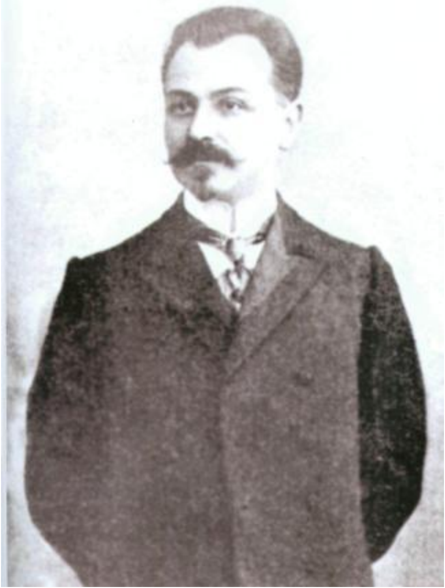
Azərbaycan Xalq Cümhuriyyəti nazirlər şurasının ilk sədri Fətəli xan Xoyski