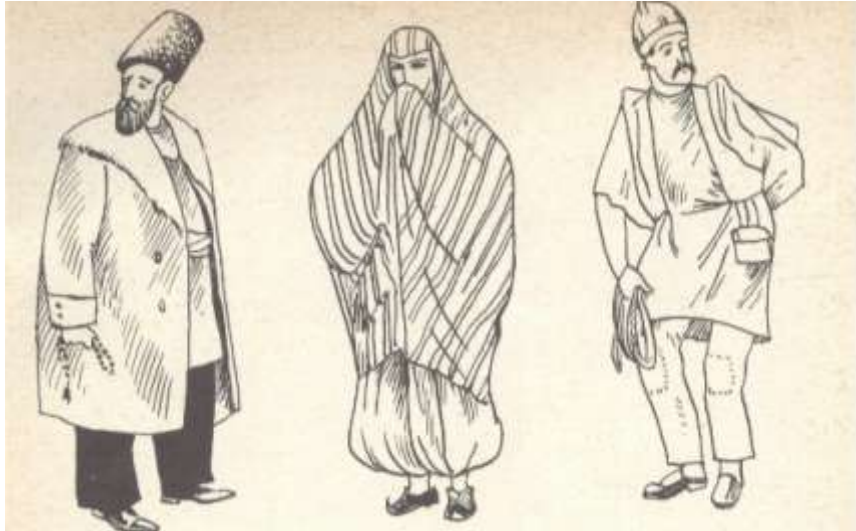
Bakının köhnə tiplərindən