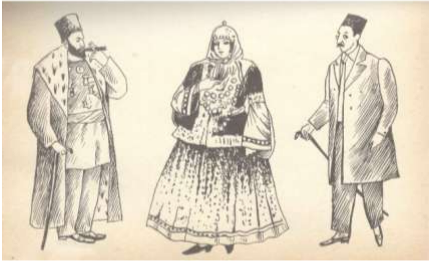
Bakının köhnə tiplərindən