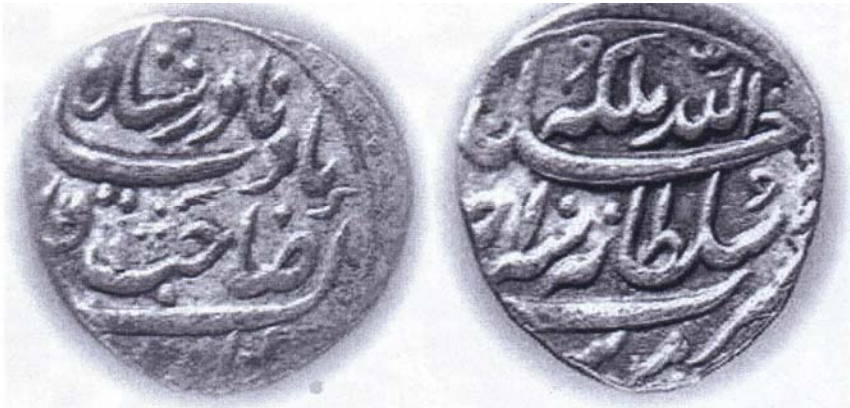
Nadir şahın adına vurulmuş sikkələr