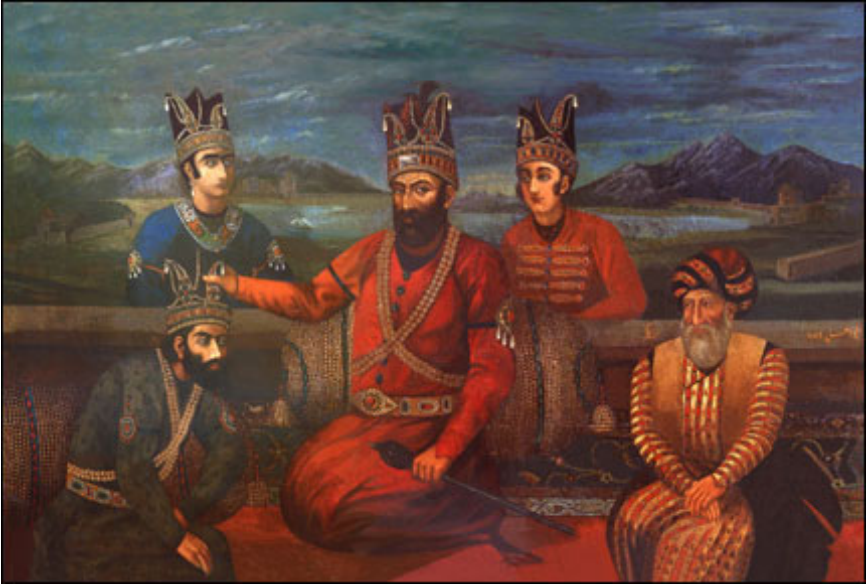
Nadir şah və övladları