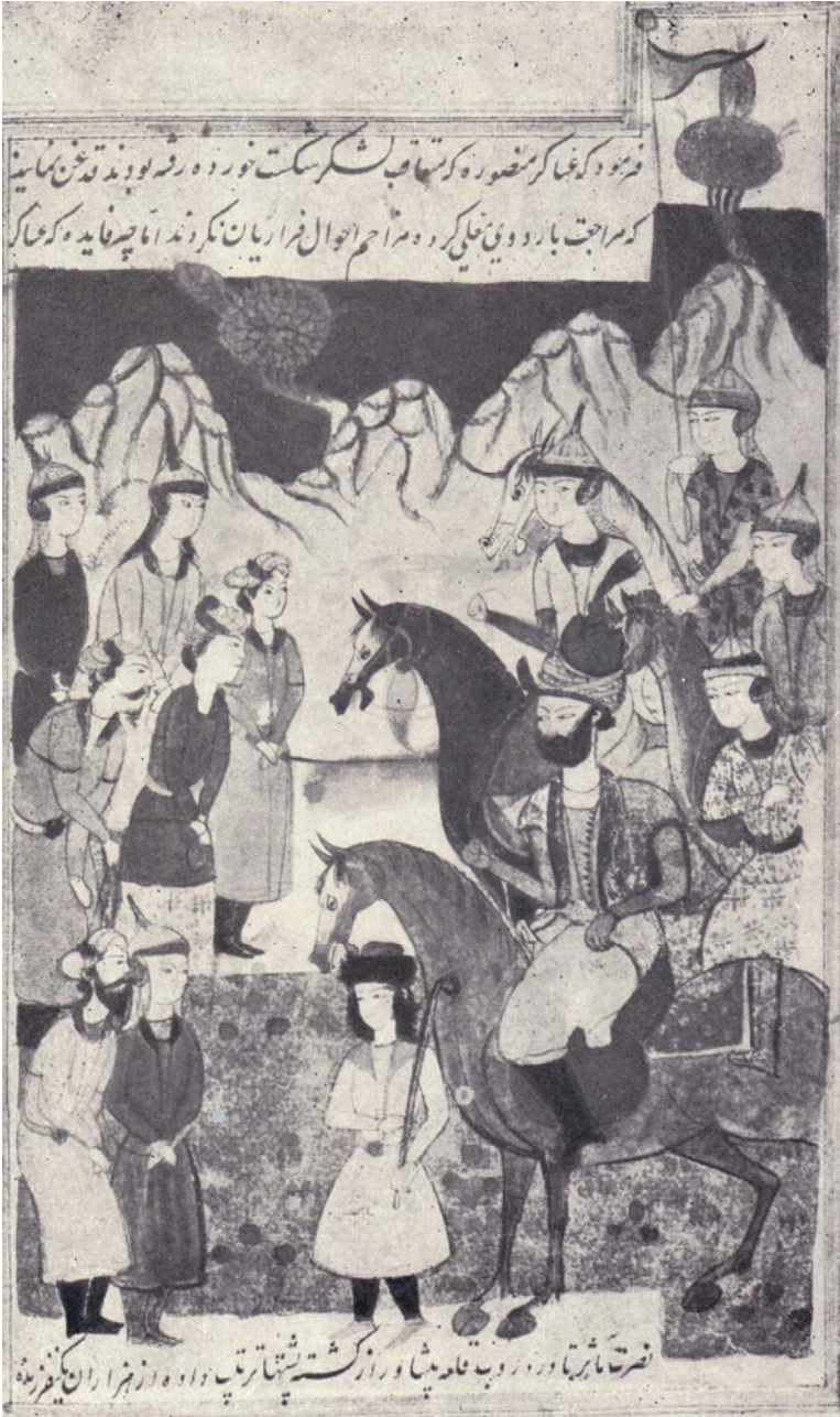
Nadir şahın Hindistan səfəri