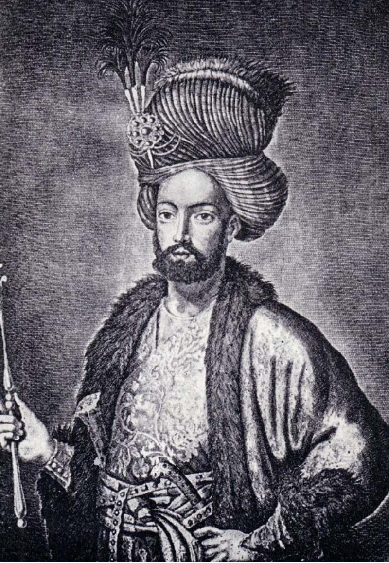
Şah Sltan Hseyin