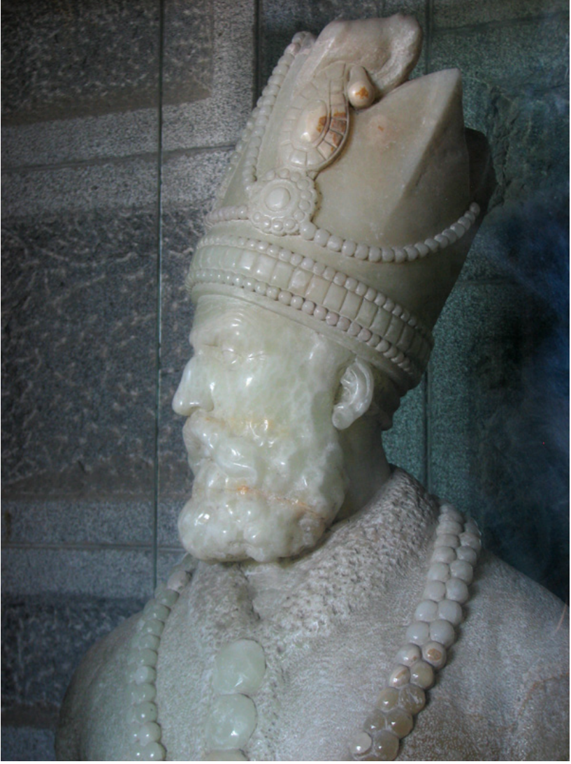
Nadir şahın büstü