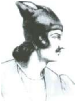
Şahzadə Xosrov Mirzə Abbas Mirzə oğlu Qacar (1813-1875)