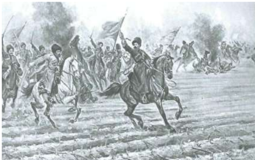
Port-Artur, 1905-ci il yanvarın 14-də polkovnik Hüseyn xan Naxçıvanskinin alayı Landunqoy kəndini azad edərkən. Rəssam V.V.Mazurovskinin əsəri.