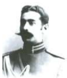
Rotmistr Əbdülhəmid bəy Qaytabaşı 1906-cı il, Peterburq