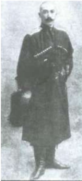
General-mayor Feyzulla Şəfi xan oğlu Qacar (1872-1920)