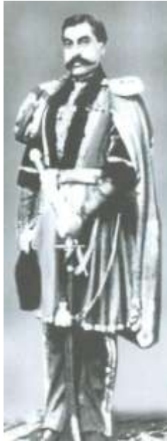
General Rzaqulu Mirzə Qacar