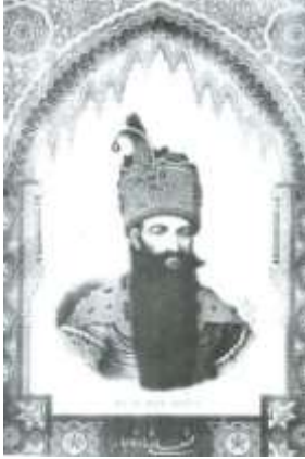
Fətəli xan Qacar (1766-1834)