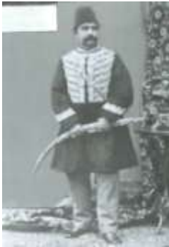
Şahzadə -general Kamran Mirzə Qacar (1855- 1928)