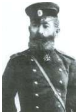
Tam artilleriya generalı Səmədbəy Mehmandarov 1916-cı il Birinci Dünya Müharibəsində.