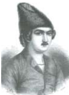
Хосров-Мирза персидский принцъ р. 1813-1875.