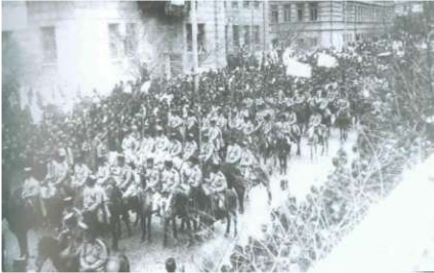
1919-cu il aprelin 5-də Azərbaycan Milli Ordusunun Gəncədən Bakıya girdiyi gün. İstiqlal küçəsi