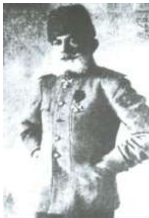
İlk hərbiyyə naziri, Tam artilleriya generalı Səməd bəy Sadıq bəy oğlu Mehmandarov (1855-1931)