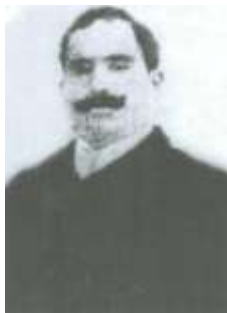
General Əsədullah xan Əbülfəthzadə (?-1918)