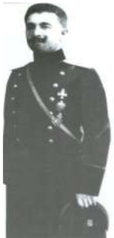
Milli ordu generalı Cavad bəy Məmməd ağa oğlu Şıxlinski (1874-1959)