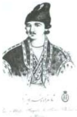
Şahzadə Xosrov Mirzə Qacar