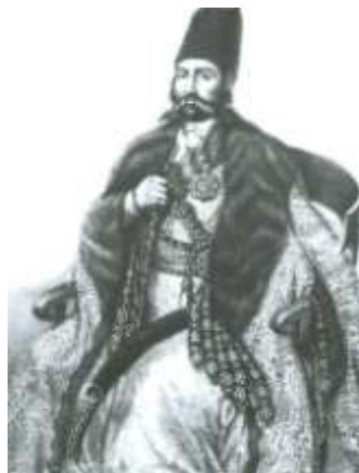
Şahzadə Bəhmən Mirzə Qacar (1811-1884)