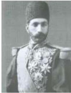
Şahzadə-general Həsən xan Qacar (?-1855)