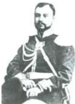
General-leytenant Məmməd bəy Sulkeviç (1863-1920).