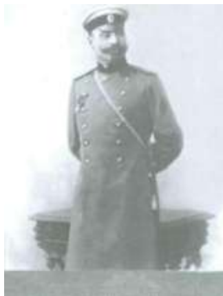
Hərbiyyə nazirinin müavini, Tam artilleriya generalı Əliğa Hacı İsmayıl oğlu Şıxlinski (1865-1943)