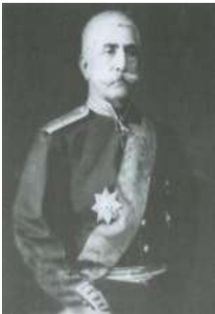
Портрет Ген-м Исрафил бека Иедигарова. Место съемки Тифлис