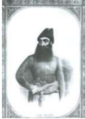
Şahzadə Abbas Mirzə Qacar (28.08.1789-25.10.1833)